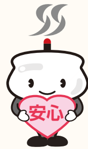
さいたまそうぎ社連盟 キャラクター2代目香炉君

「その場で入会」 「事前に入会」 いろいろお得な 特典がたくさん! 葬儀代以外にかかる 費用で見落としがちな お布施代… ここなら安心!